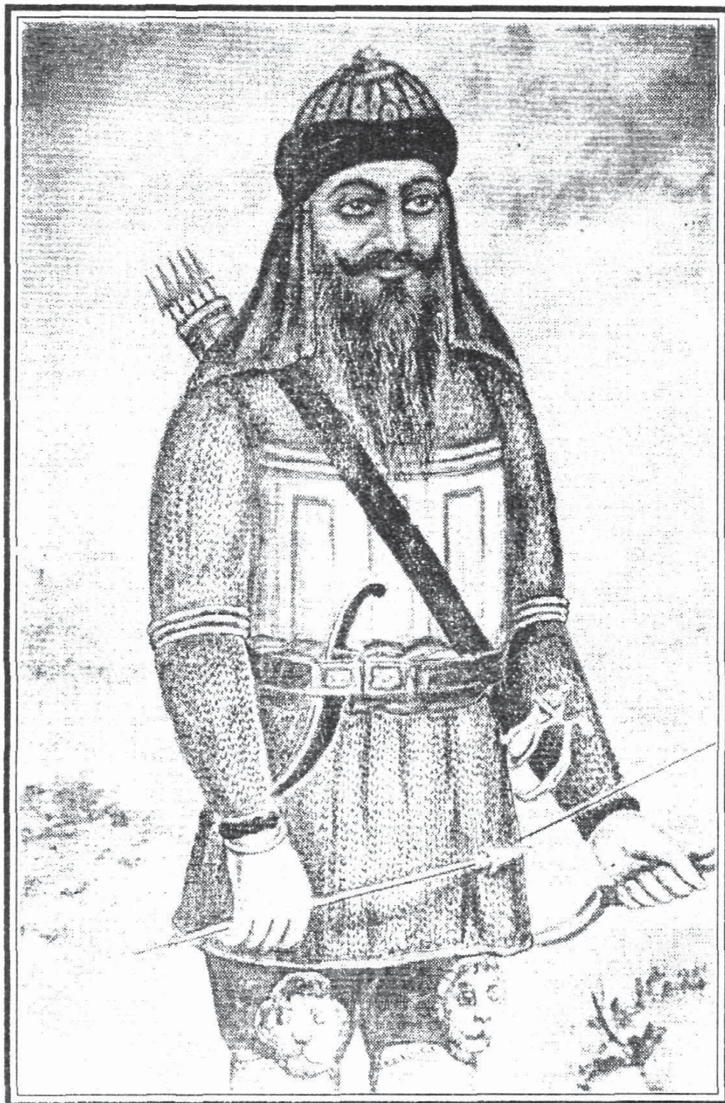
ਬੰਦਾ ਸਿੰਘ ਬਹਾਦੁਰ